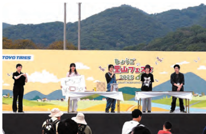
ユースサポーターによる里山イベント