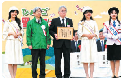
開催にご支援いただいたTOYO TIRE グループ環境保護基金様への感謝状贈呈