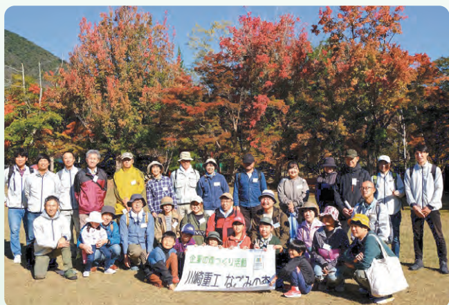
活動に参加された笑顔の皆さん