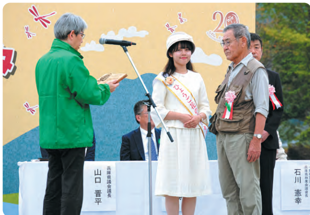
ヤッホの森湿地を育む会様