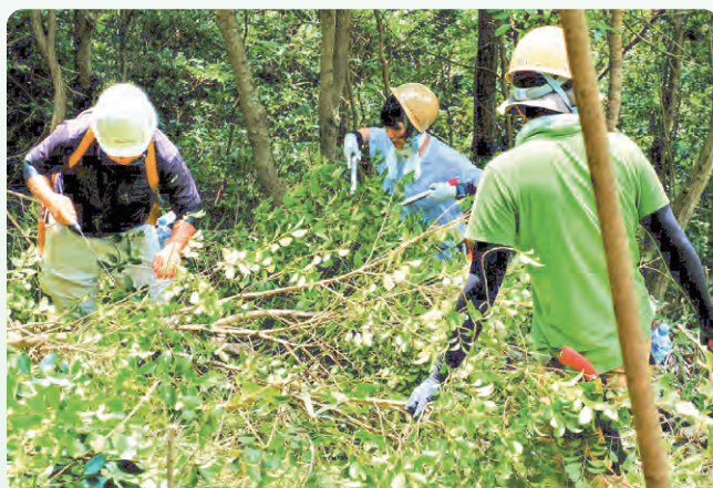
伐採した常緑樹の枝払い