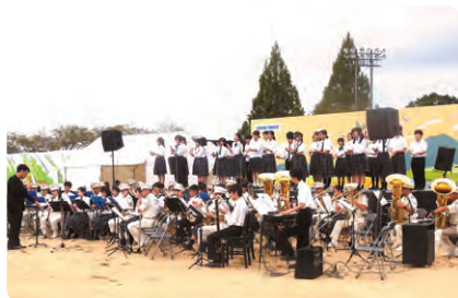
たつの市立龍野東中学校吹奏楽部と 県警音楽隊のコラボ演奏

吹奏楽コンサート(たつの市立龍野東中学校吹奏楽部と県警音楽隊によるコラボ演奏)、たつの市の“いいもの”発信、ユースサポーターによる里山イベント、チェーンソーアート