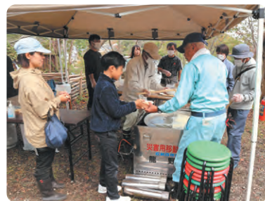
にゅうめん試食会