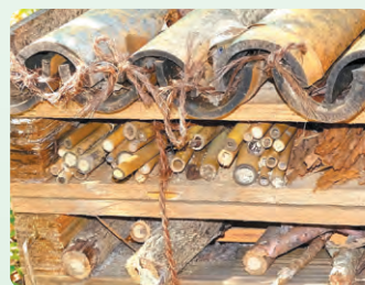
「虫のホテル」の竹の中にハチが産卵