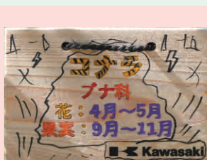
手作りのコナラの樹名板