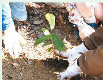
現地で種を採り本場で育てた苗木の植栽