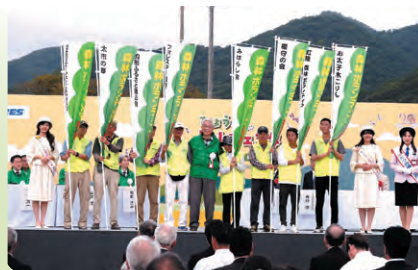
森林ボランティア活動報告