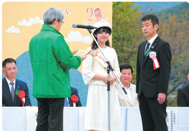
株式会社日本海水様