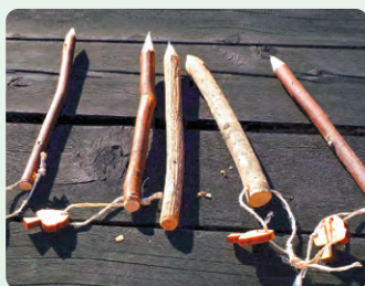
除伐木の枝で作った手作りの鉛筆