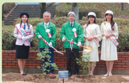
記念植樹(コヤスノキ)