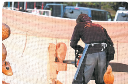
チェーンソーアートの実演