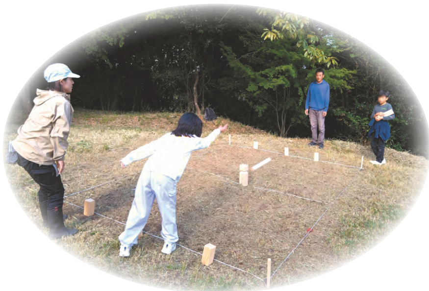
ゲーム体験(クップ)

里山林整備プチセミナー、木をきる里山林整備体験のほか、木工工作、里山遊び(ゲーム)など、里山での「遊び」と「学び」を体験するとともに、たつの市の特産品試食会も催されました。