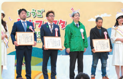
林業労働賞の表彰