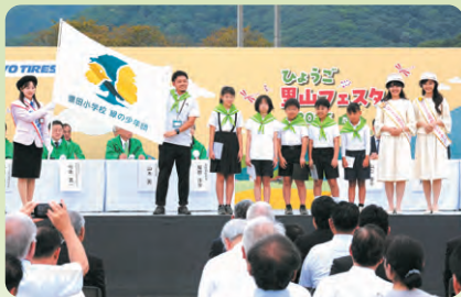
菅田小学校 緑の少年団による宣誓