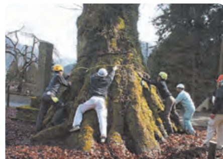
地域で親しまれているシンボリックな巨樹の診断や治療を支援しています。