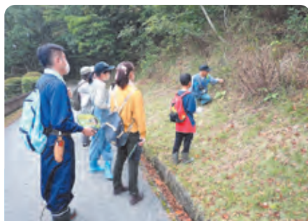
自然観察会の実施や森や緑を活用した学習体験活動を支援しています。