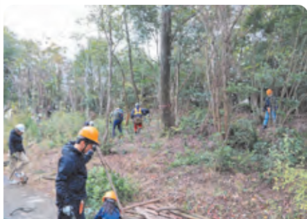
森林ボランティア団体等が実施する森林整備や緑化活動、指導者育成研修活動を支援しています。