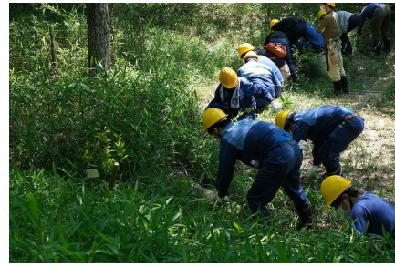
東洋ゴム工業労働組合 (植栽木を覆っているササ等の除去：加東市)