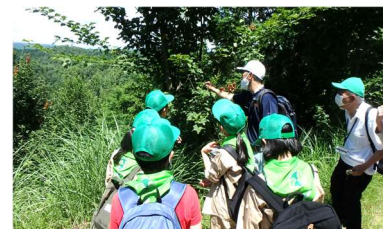
緑の少年団の自然観察会

次代を担う子どもたちが、環境学習等を通じて森や緑に関する知識を深められるよう、全県的な緑の少年団の育成に取り組む兵庫県緑の少年団連盟の活動への支援を行った。