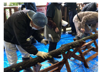
国見の森公園でのしいたけ植菌体験

小学生を対象にした木工クラフト教室や一般県民を対象にしたしいたけ植菌体験イベント等を開催し、体験しながら森の働きや恵みが学べる体験学習への支援を行った。