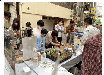
ひょうご木材フェアでの展示