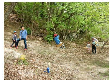
宝塚西谷の森公園での山のぶらんこ

木のコースター作り、山のすべり台・ぶらんこ等 こども向けのイベントを開催するとともに、ソメイヨシノ、ヤマザクラ、モミジの植樹をこどもたちも参加して実施した。