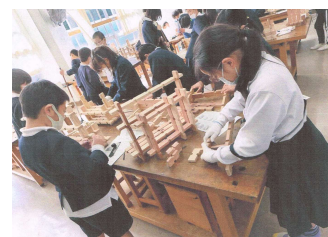
組手仕の体験（NPO 法人バイオマス丹波篠山）