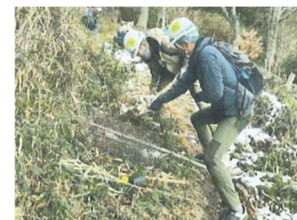
ヤマザクラ斉植樹活動 (ほくら～ととや森の世話人倶楽部)