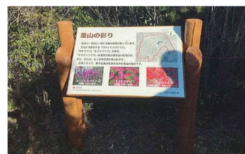
案内標識の設置（赤穂市）