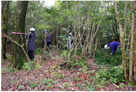
メットライフ生命保険株式会社 (日当たりを悪くしている常緑樹の除伐：神戸市)