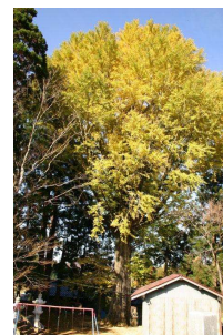
切畑区の大イチョウ（新温泉町）