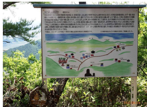
火とぼし山展望台に設置した看板